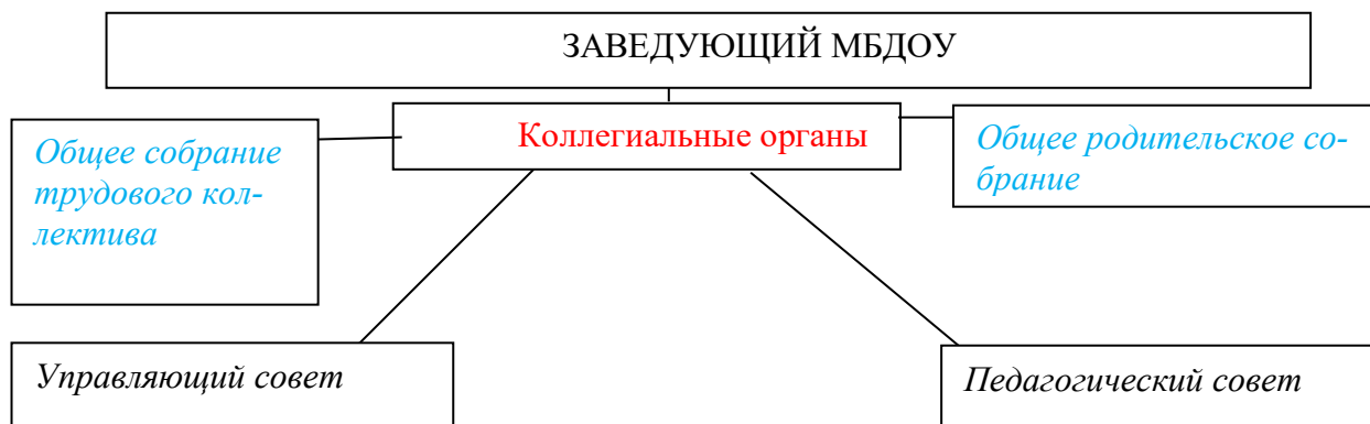
Органы управления и их функции.

целевой, содержательный и организационный разделы, обеспечивая взаимодействие администрации, педагогов, родителей и воспитанников для повышения качества образования.